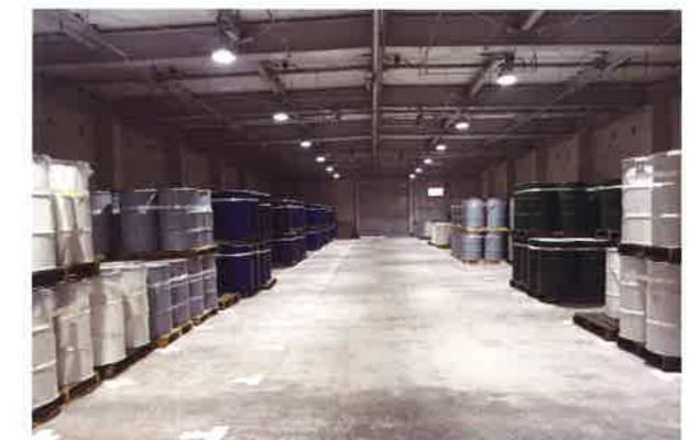
危険物倉庫内/スプリンクラー