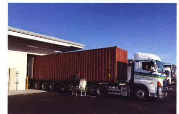
海上コンテナ荷卸し(40ft、20ft)対応