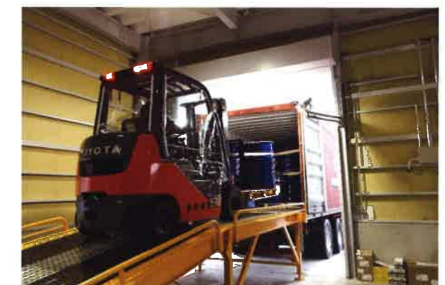
屋内バンステージ完備